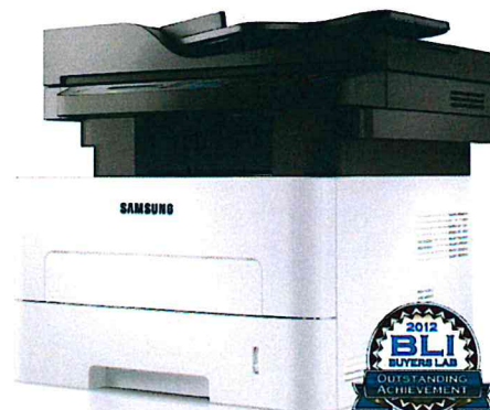
Outstanding Achievement in Innovation: Samsung Easy Eco Driver