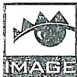
IMAGE CZ, s.r.o. Nad Ovčárnou 3357, 760 01 Zlín DIČ: CZ25572491 Provozovna Praha: Obchodní 2829/1, 193 00 Praha 9