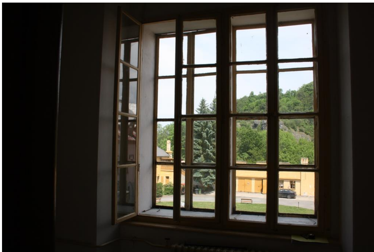
Okna na chodbě.