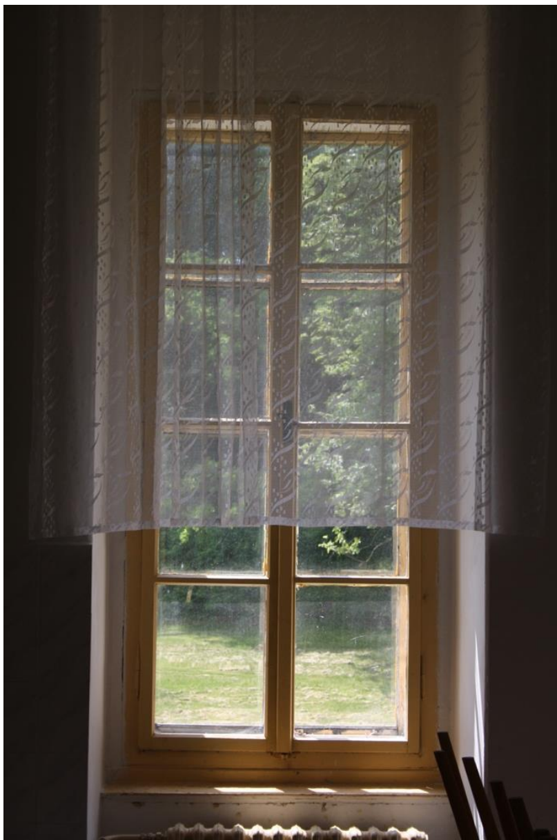
Okno v kuchyňce.