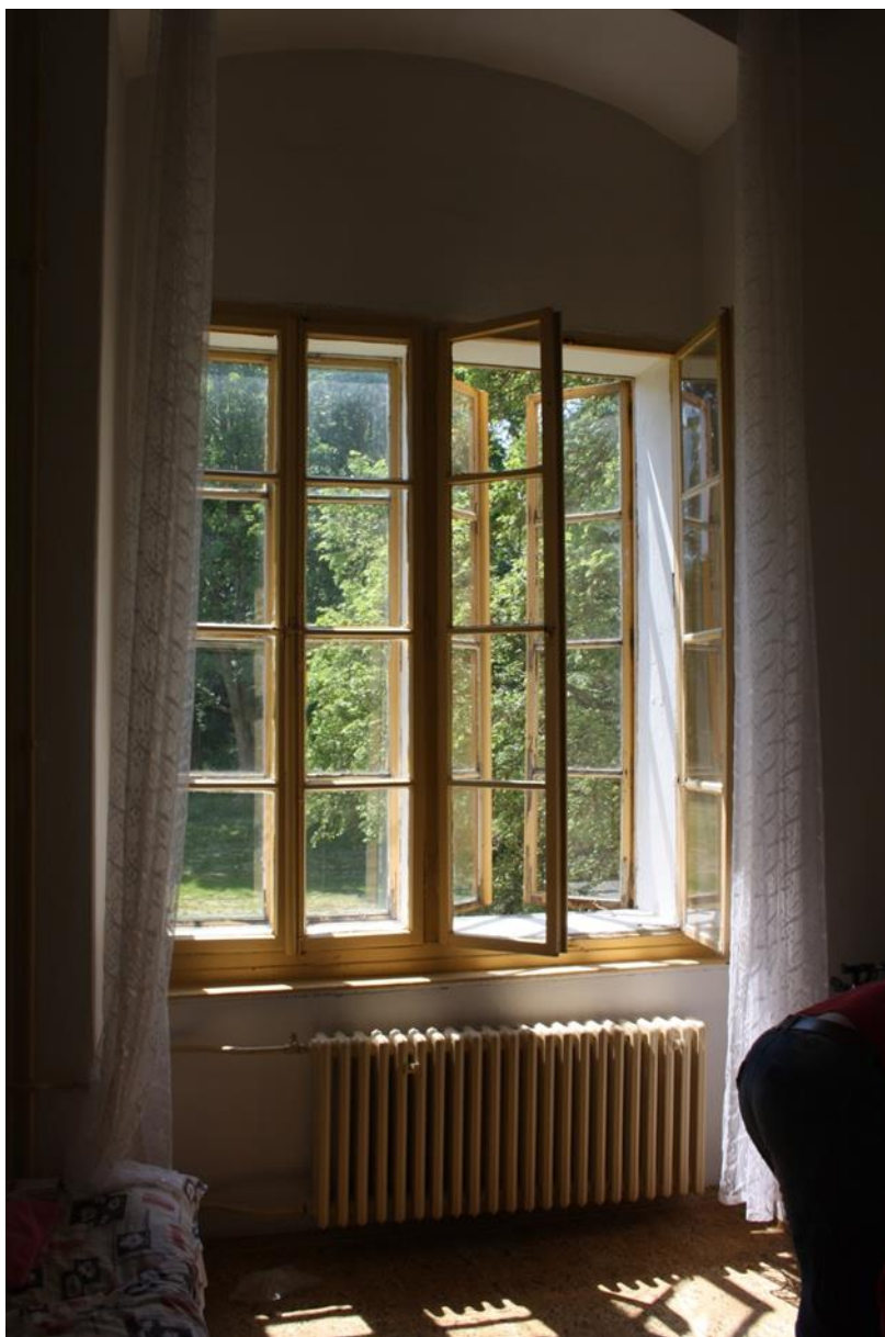
Okna v místnosti.

U ostatních oken – replik bude počítáno s tím, že venkovní okna budou zasklena izolačním dvojsklem. Kování bude nové dle odsouhlaseného vzoru / např. Alt Wien apod./.