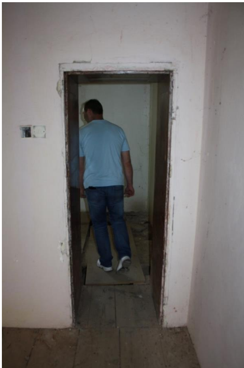
Chybějící obložky a dvevní křídlo.